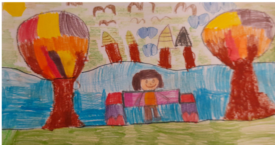
Weronika (6 lat)