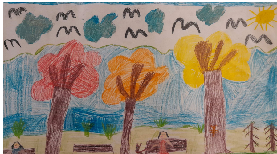
Emilka (6 lat)