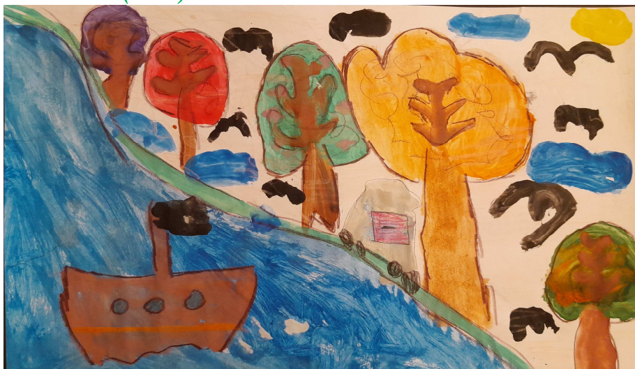
Natalka (6 lat)