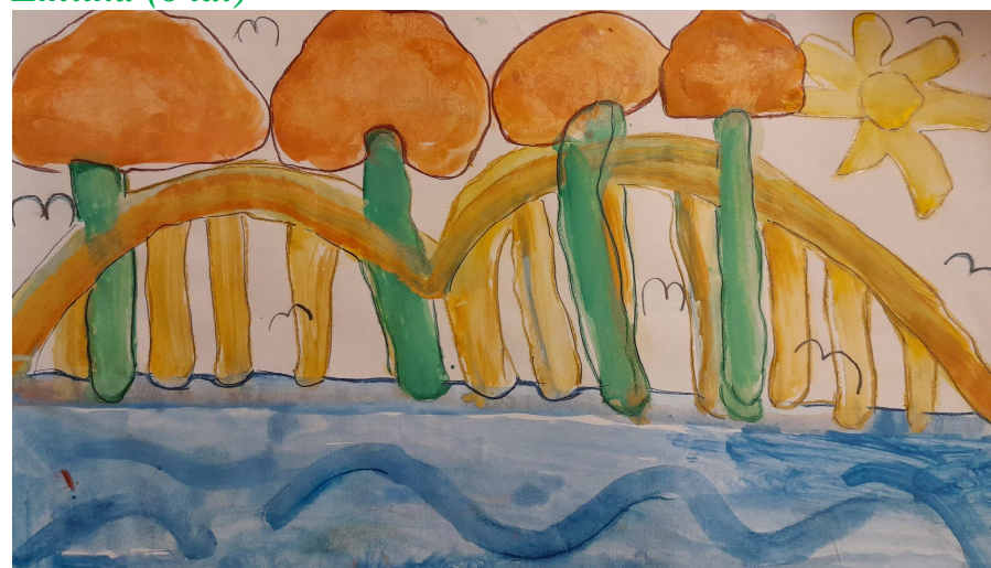
Adaś (6 lat)